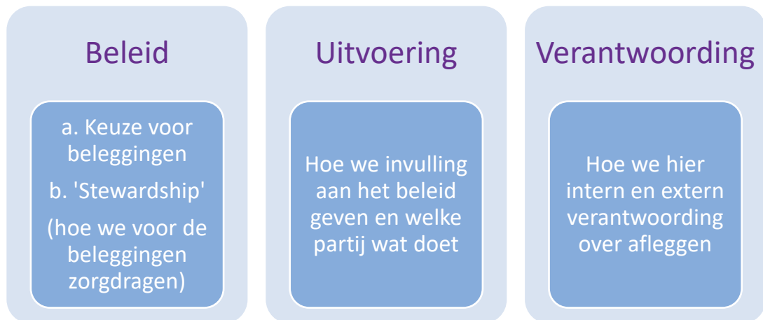
Figuur: MVB bij Philips Pensioenfonds

Bij MVB onderscheiden wij twee aspecten a. de keuze voor beleggingen en b. stewardship (hoe we voor de beleggingen zorgdragen). Dit zijn dan ook de twee belangrijke bouwstenen van het MVB-beleid die in paragraaf 1.2 en paragraaf 1.3 worden uitgewerkt. Vervolgens gaan paragraaf 1.4 en paragraaf 1.5 over de uitvoering van deze bouwstenen van het MVB-beleid. Daar leggen we uit hoe het MVB-beleid wordt uitgevoerd en door welke partijen. En de wijze waarop hierover verantwoording wordt afgelegd wordt uitgewerkt in paragraaf 1.6. Onderstaande figuur geeft dit schematisch weer.